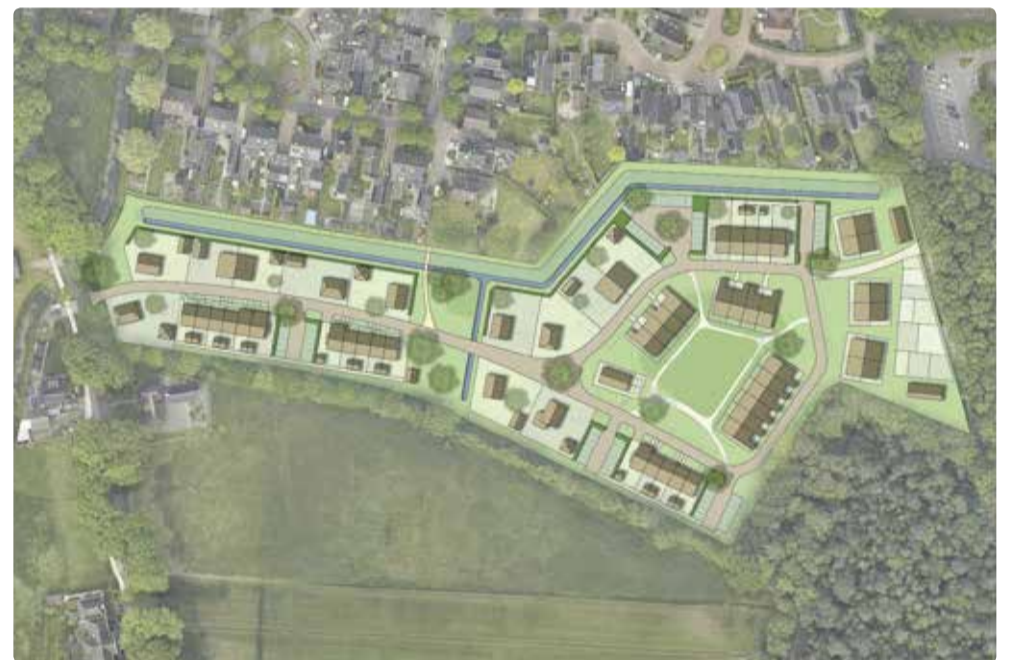
Een voorbeelduitwerking uit het Stedenbouwkundig plan. De plaatsing van gebouwen en bijgebouwen is indicatief.