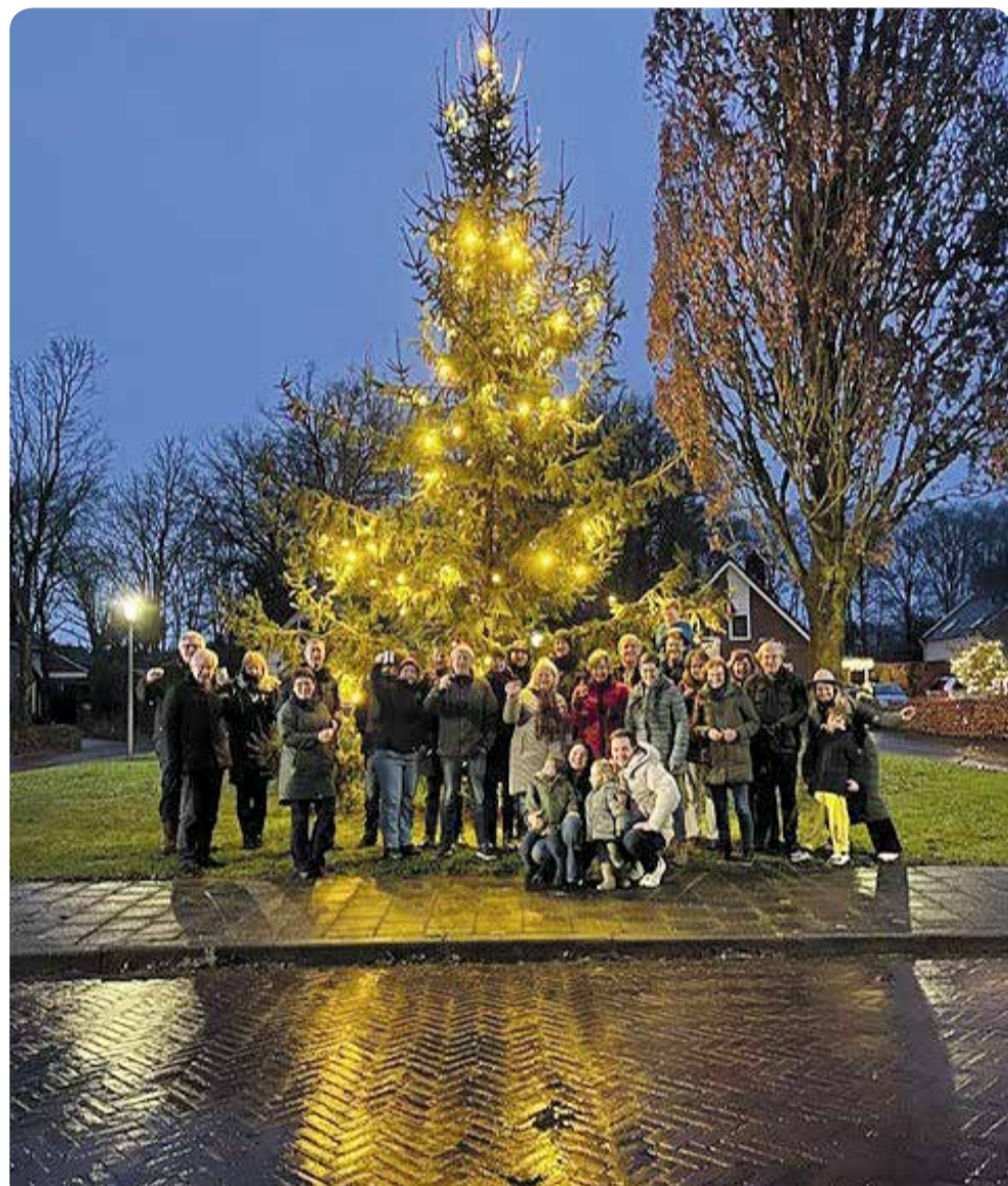
bewoners van de Burgemeester Crommelinlaan bij de gezamenlijke Kerstboom

Ook ontvingen alle betrokkenen van WijDeventer de wens voor een fantastisch mooi 2025. Vanaf deze plek de allerbeste wensen terug voor een mooi en gezellig 2025 met elkaar in de straat!