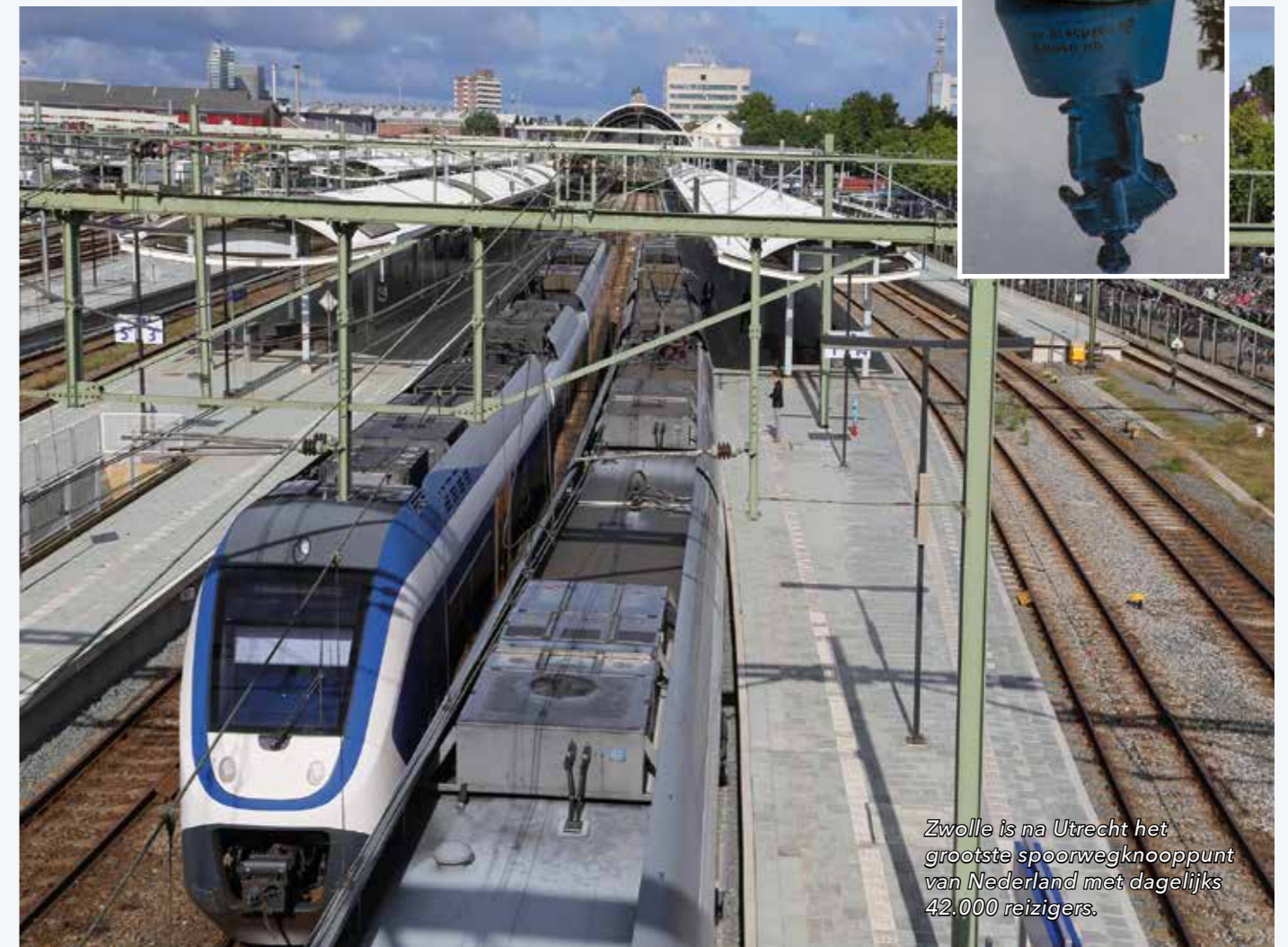
Zwolle is na Utrecht het grootste spoorwegknooppunt van Nederland met dagelijks 42.000 reizigers.