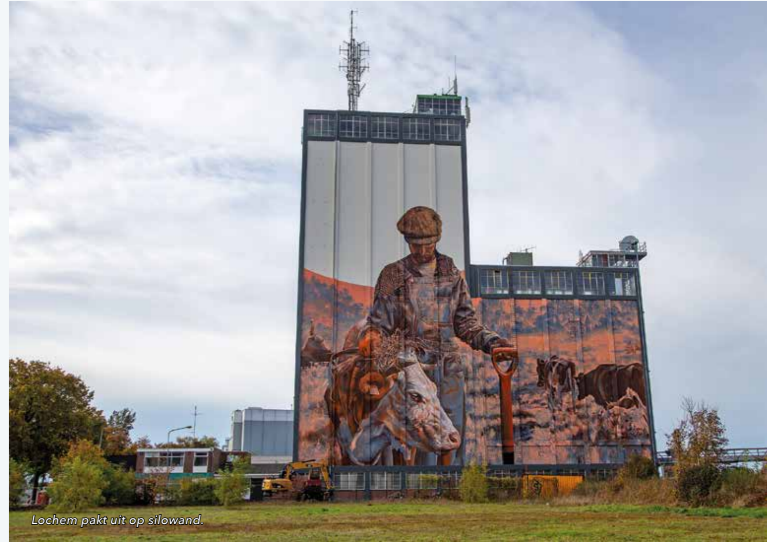
Lochem pakt uit op silowand.