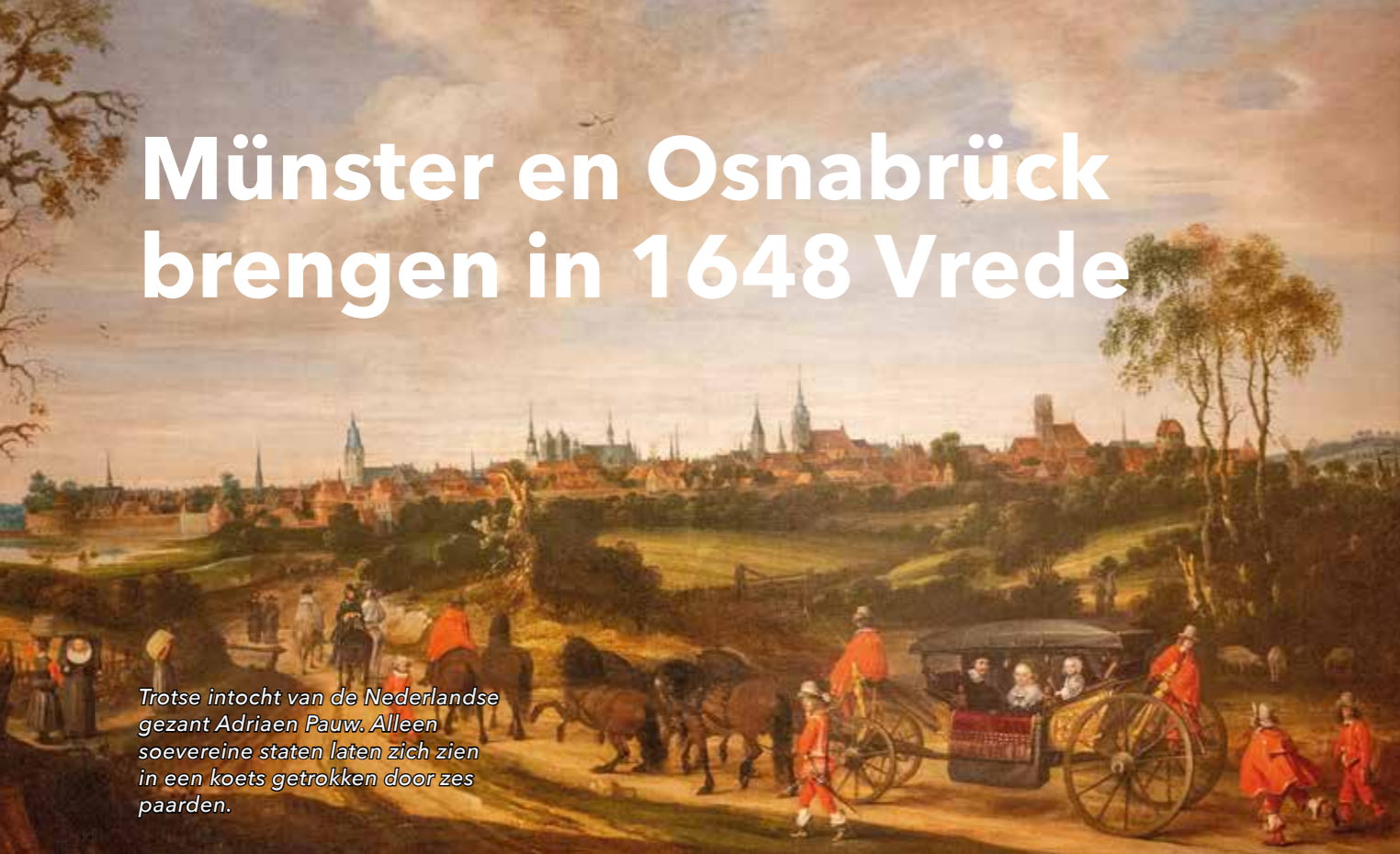
Trotse intocht van de Nederlandse gezant Adriaen Pauw. Alleen soevereine staten laten zich zien in een koets getrokken door zes paarden.