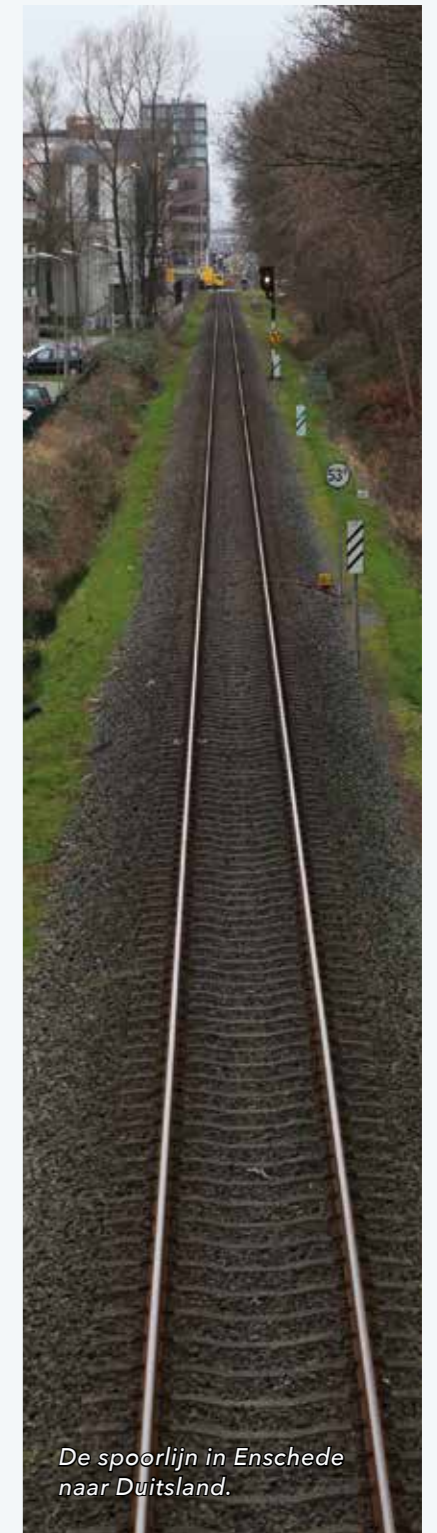
De spoorlijn in Enschede naar Duitsland.