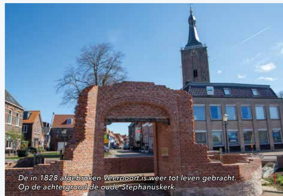
De in 1828 afgebroken Veerpoort is weer tot leven gebracht. Op de achtergrond de oude Stephanuskerk.

Eindelijk een brug: 1828. Zwolle protesteerde. Zonder succes dit keer. Hanzesteden werken graag samen maar zijn ook elkaars concurrenten. Zo slaagden Deventer en Kampen tot 1819 te voorkomen dat Zwolle een open verbinding kreeg met de IJssel. De ophaalbrug die Hasselt in 1828 voltooidde was een gewaagde investering. Oei, van de begrote 42.000 gulden moest de stad zelf een derde ophoesten. Vanwege de opkomst van de raderstoomboten kwam bovenop dat bedrag nog eens 15.000 gulden. Een lange neus naar Zwolle? Nou nee. Hasselt hoopte op een herleving van zijn belangrijke rol in de landroute van de steden langs de Zuiderzee en de IJssel naar Friesland. De bijna twee eeuwen geleden aangelegde rijksstraatweg echter omzeilt Hasselt. Kiest verder landinwaarts voor de route Zwolle - Meppel - Steenwijk. De ophaalbrug van 1828 was niet de eerste verbinding in Hasselt over het Zwartewater. In 1522 al kreeg de stad toestemming van de bisschop van Utrecht (de landsheer) om een brug te bouwen. De bisschop was kwaad dat Zwolle de kant van Gelre koos en gaf de stad een tik over de vingers. Toen Zwolle twee jaar later terugkeerde in het kamp van de bisschop eiste de stad dat de brug in Hasselt werd afgebroken. Knarsetandend voltrok zich de sloop. Tot 1828 moest Hasselt zich weer tevreden stellen met een pont over het Zwartewater.