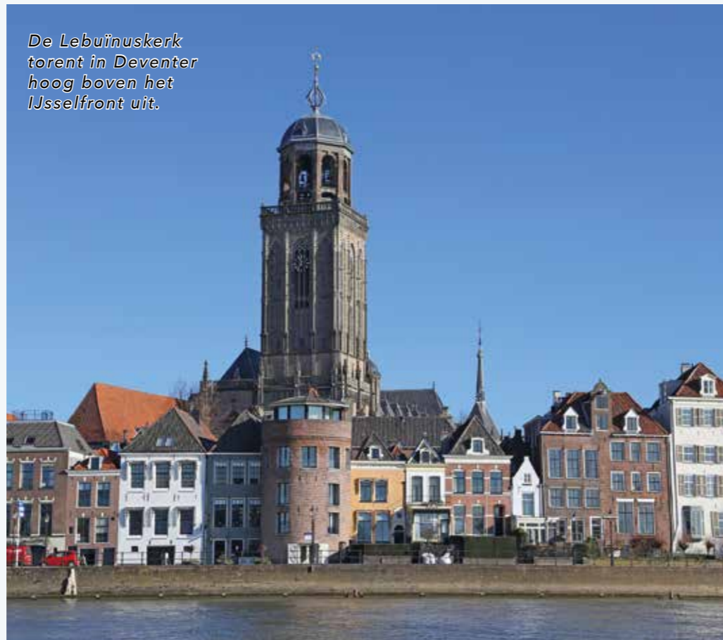
De Lebuïnuskerk torent hoog boven het IJsselfront uit.

Reacties en bijdragen aan HalloHanze zijn van harte welkom. Stuur ze op naar: HalloHanze@theoleone.nl