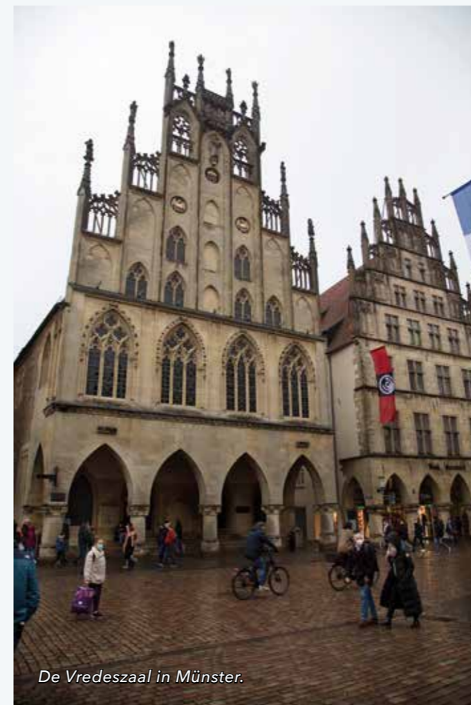
De Vredeszaal in Münster.

en ongehinderd op en neer reizen. Aan de ingewikkelde vredesbesprekingen namen 109 afgevaardigden deel. Sommigen van hen behartigden de belangen van meerdere partijen. De terugkoppeling van de voorgenomen besluiten had veel voeten in de aarde en vergde vrachten tijd. Van Stockholm en Wenen tot Parijs, Madrid en Amsterdam deed ieder zijn zegje. En dat in een tijd dat iedere twintig kilometer een dag reizen betekende. Snelle koeriers konden als alles mee zat de zestig kilometer halen. In 1648 komt na drie jaar van moeizaam onderhandelen - in twee trappen - de Vrede van Westfalen tot stand. De in mei gesloten Vrede van Münster betekent de start van de jonge onafhankelijke Republiek der