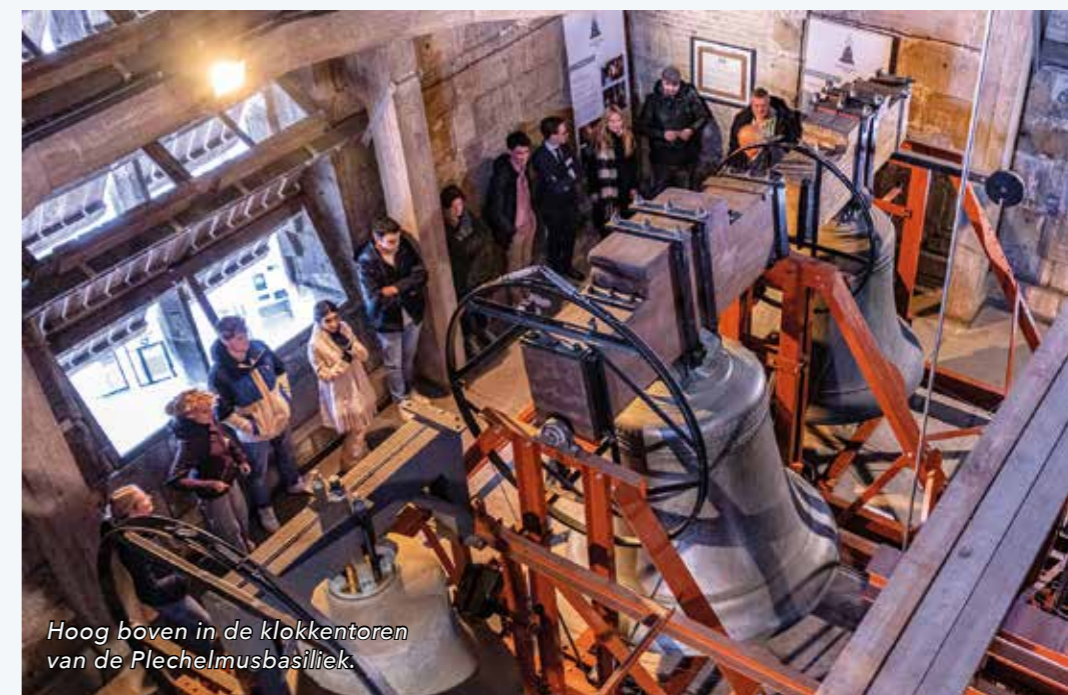
Hoog boven in de klokkentoren van de Plechelmusbasiliek.

International en de Nederlandse Jeugdhanze. Het treffen op 13 april bleek een prima opstap naar de Internationale Hanzedag die in juni plaats vindt in de Poolse stad Torun. Geen enkel punt van kritiek? Achteraf was geen handige zet om de jongeren op een doordeweekse dag bijeen te brengen. Daardoor was de groep Duitse belangstellenden minder groot dan mogelijk. Toch waren jongeren van de partij uit steden als Emmerich, Vreden en Lübeck. Via de link twentefm.nl en het kopje iets gemist is het op 13 april gegeven interview met Pepijn Velthuis te beluisteren.