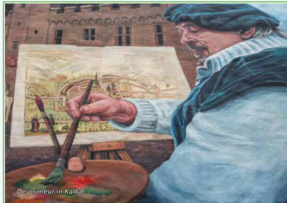
De primeur in Kalkar.