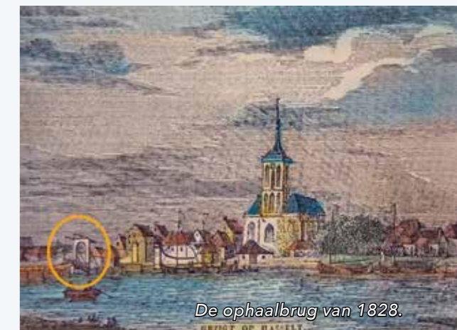
De ophaalbrug van 1828.

Hasselt was eeuwenlang een belangrijke schakel in het vervoer van Bentheimer zandsteen. Het materiaal vanuit de groeves van de graaf nam in Schüttof de boot en arriveerde via Vecht en Zwartewater Hasselt. De zandsteen werd overgeladen in grotere schepen voor het verdere transport. In 1648 sloten Amsterdamse kooplieden een contract met de graaf van Bentheim voor de levering van jaarlijks 80.000 kuub steen. Het Paleis op de Dam is gebouwd van Bentheimer zandsteen.