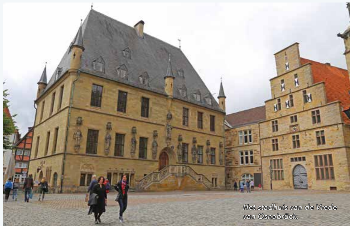
Het stadhuis van de Vrede van Osnabrück.

vooral toch maar Spanje klein te krijgen. De strijd om onafhankelijkheid in de Lage Landen aan de Noordzee ging de geschiedenis in als de Tachtigjarige Oorlog. De Hanzesteden Münster en Osnabrück speelden een sleutelrol bij de beëindiging van het oorlogsgeweld. Hoe alle 194 vechtende landen en landjes om de tafel te brengen?