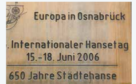
Herinnering Hanseitag 2006.

Zeven Verenigde Nederlanden. In oktober van het zelfde jaar komt de Vrede van Osnabrück tot stand en is de Westfaalse Vrede compleet. De kaarten in Europa worden opnieuw getekend. Tussen de beide vredeszalen vormde zich op 24 februari 2023 een menselijke keten van 20.000 personen. Motto: Peace Now! De mensen kwamen op de been precies een jaar na de inval van Rusland in de Oekraïne.