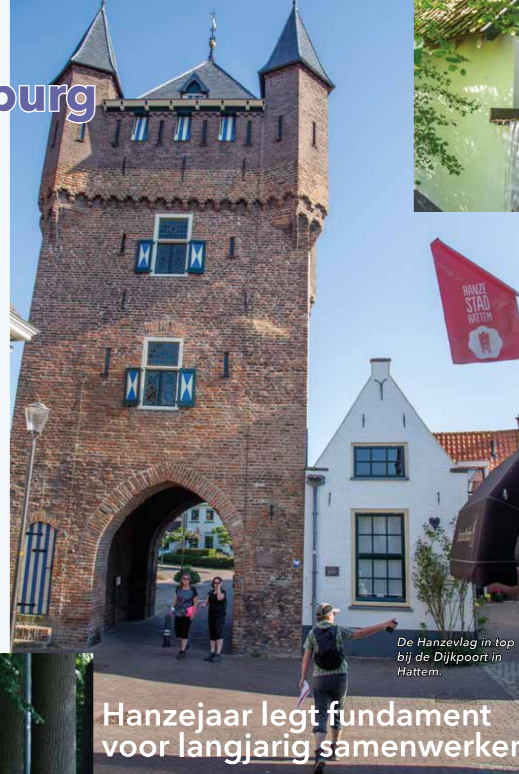
De Hanzevlag in top bij de Dijkpoort in Hattem.