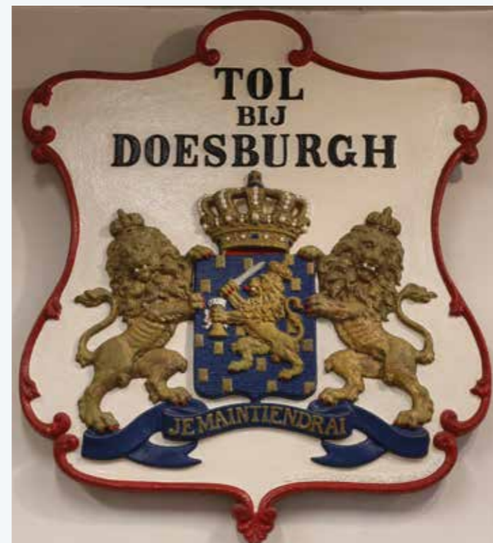
Handelaren gebruikten Hessenwegen om tolheffingen te voorkomen.

De route startte in Doesburg op de evenementenlocatie in de Turfhaven. Via winkels en het stadhuis snelden de sportievelingen naar de mosterdfabriek en het Arsenaal.