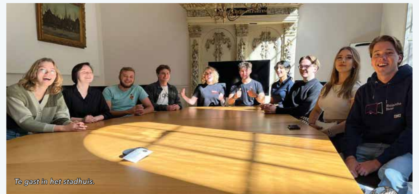
Te gast in het stadhuis.

Op de zaterdag volgde een speciale Hanze-tour en een bezoek aan de markt. In Deventer werden vroeger zeer belangrijke jaarmarkten gehouden, onder andere op de plek van de huidige markt. Het weekeinde Hanze werd afgerond met een bezoek aan pittoreske boetiekjes en winkeltjes. Al met al een zeer geslaagd weekend.