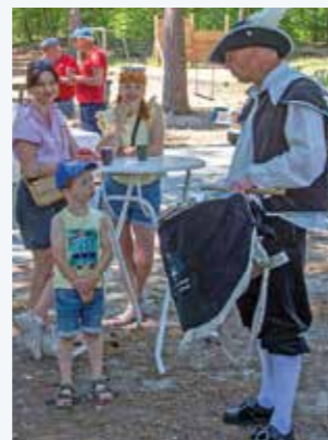
Oekraïensen verrasten de wandelaars met soep, de schutterij roerde de trom.

Onderweg zagen de wandelaars oude landgoederen, uitgestrekte heidevelden en een enkele watermolen. In de steden stoere stadspoorten, fraaie gevels en gezellige terrassen. Verrassingen vormden de voorbijtrekkende schutterij en op het rustpunt heerlijke soep van Oekraïense makelij. Hattem en Elburg denken na om van wandeltocht tussen beide steden een traditie te maken.