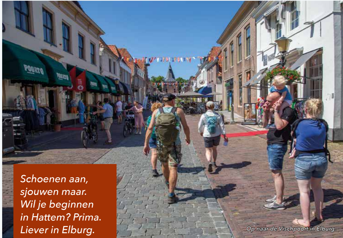
Op naar de Vischpoort in Elburg.

Schoenen aan, sjuwen maar. Wil je beginnen in Hattem? Prima. Liever in Elburg. Ook goed.