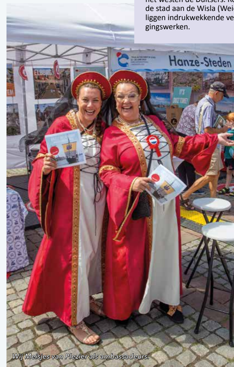
Wij Meisjes van Plezier als ambassadeurs.

Met Torun als gaststad en als adembenemend decor, waren de Hanzedagen een fantastische ervaring die smaakt naar meer. In 2024 zijn de Meisjes van Plezier er weer graag bij in Gdansk.