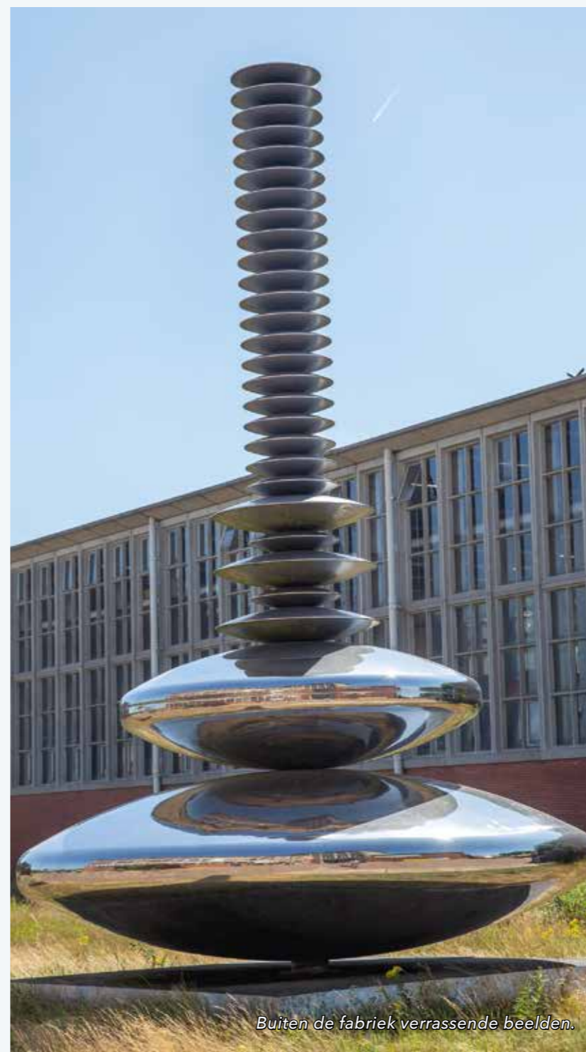
Buiten de fabriek verrassende beelden.

Een bezoek aan de IJsselcentrale-weg staat garant voor een ontdekkingstocht vol verrassingen ten aanzien van industrieel erfgoed, kunst en de ontembaar mooie IJssel.