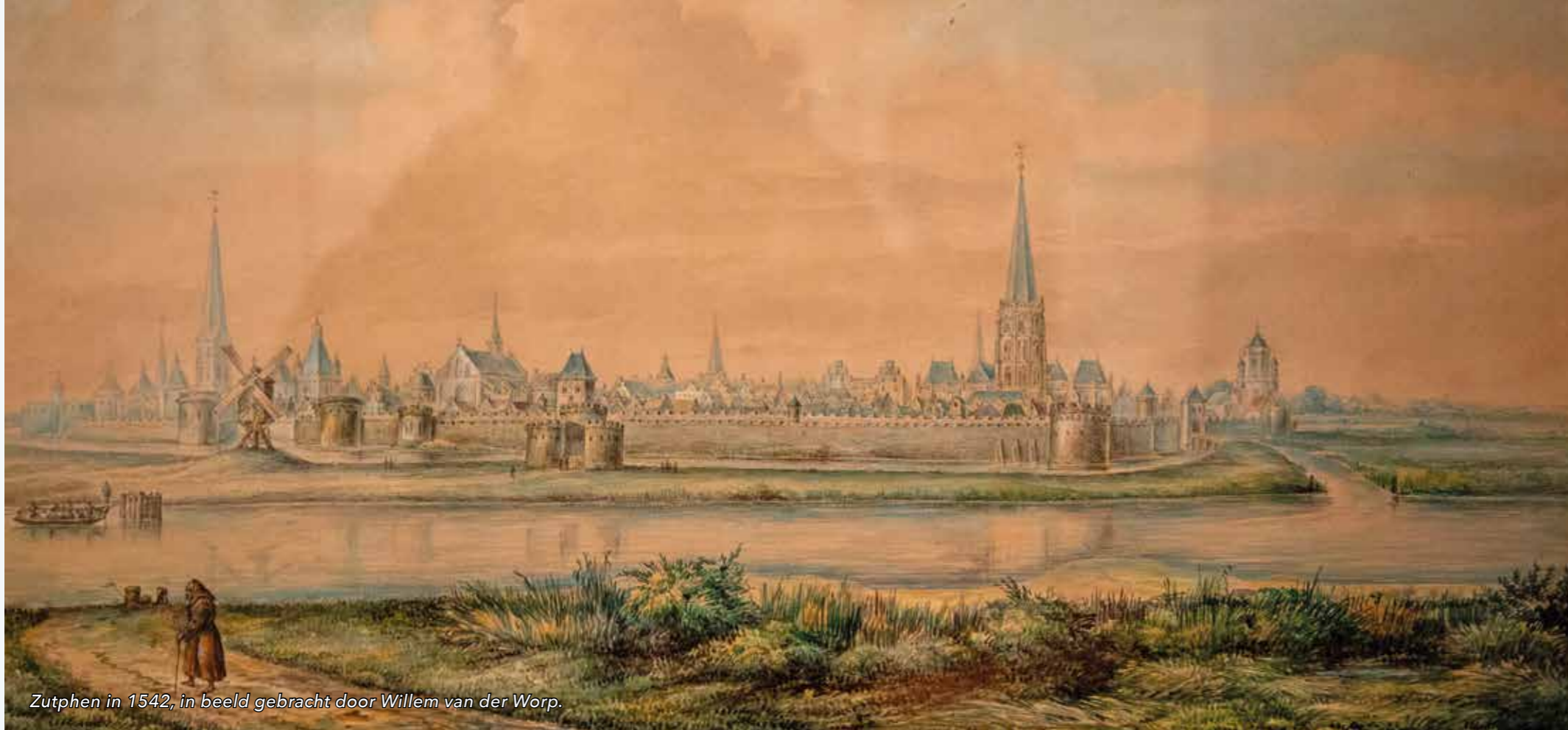
Zutphen in 1542, in beeld gebracht door Willem van der Worp.