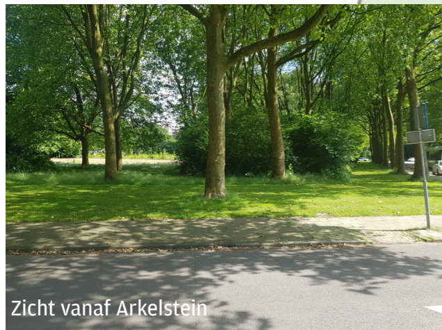
Zicht vanaf Arkelstein