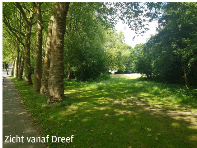
Zicht vanaf Dreef