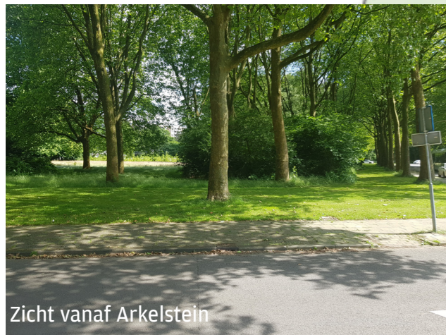
Zicht vanaf Arkelstein