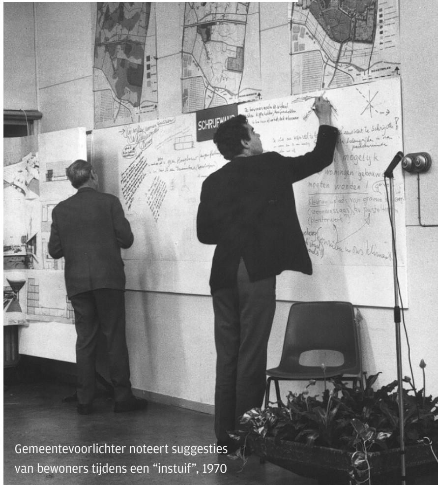
Gemeentevoorlichter noteert suggesties van bewoners tijdens een “instuif”, 1970

Participatie hoort bij Deventer, het past bij het DNA van de stad. Al in de veertiende eeuw werd het stadsbestuur gevormd door vanuit elke wijk twee bewoners te kiezen. Op die manier had het stadsbestuur goede binding met de wijken.