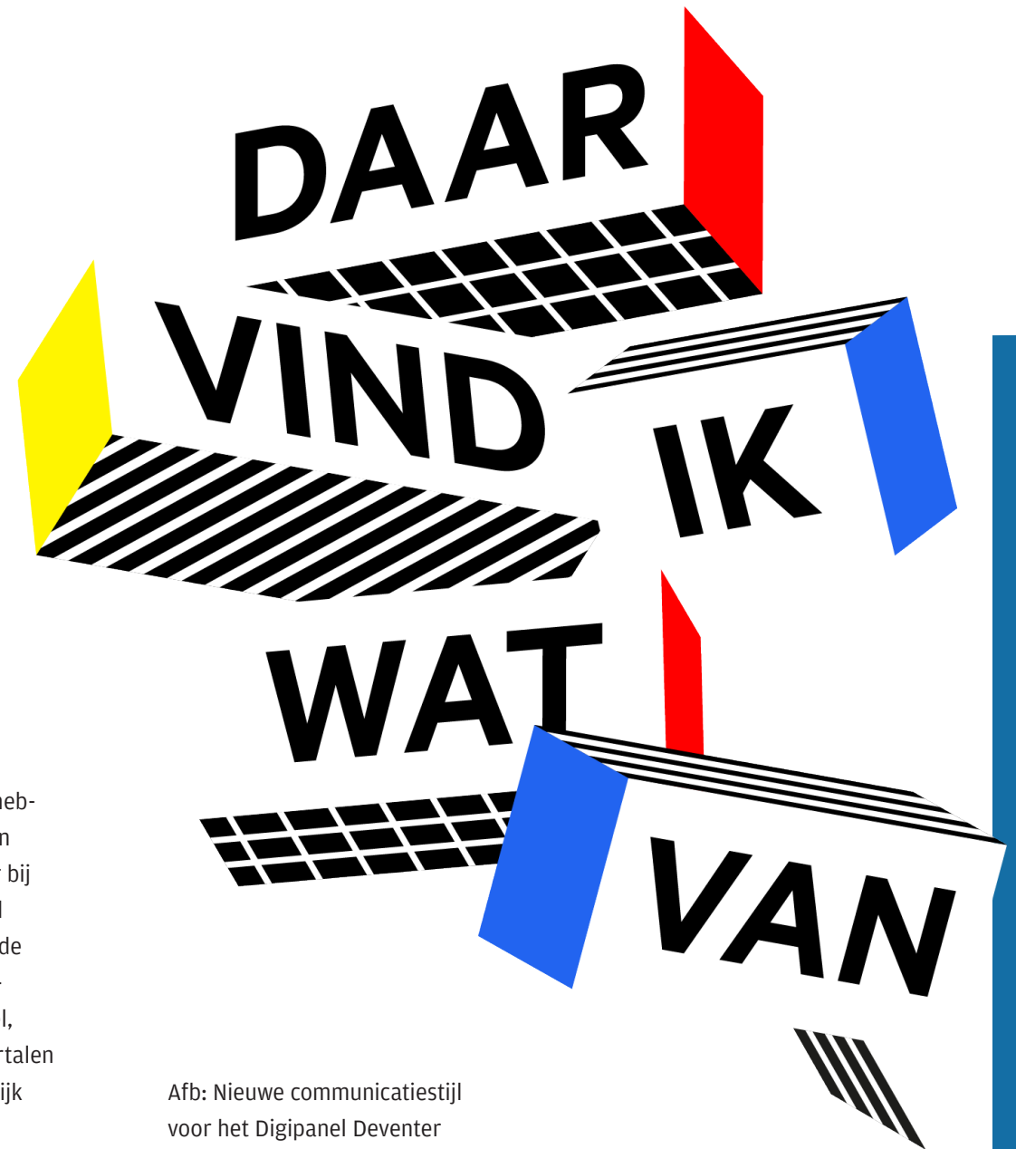
Afb: Nieuwe communicatiestijl voor het Digipanel Deventer

Participatie is in Deventer niet nieuw. Inwoners en andere belanghebbenden hebben al veel mogelijkheden om invloed uit te oefenen en zeggenschap te hebben. Denk aan ondersteuning van WijDeventer bij een initiatief voor de buurt, de Ideeënmarkt van de gemeenteraad en het Raadsforum waar iemand een idee onder de aandacht van de gemeenteraad kan brengen, participatietrajecten voor beleidsontwikkelingen en projecten, maar ook het Slim Melden, het Digipanel, Adviesraden en de formele zienswijzen. Al deze mogelijkheden vertalen we in 2023 in een digitaal participatieportaal, zodat ze overzichtelijk zijn weergegeven en voor inwoners eenvoudig te vinden zijn.