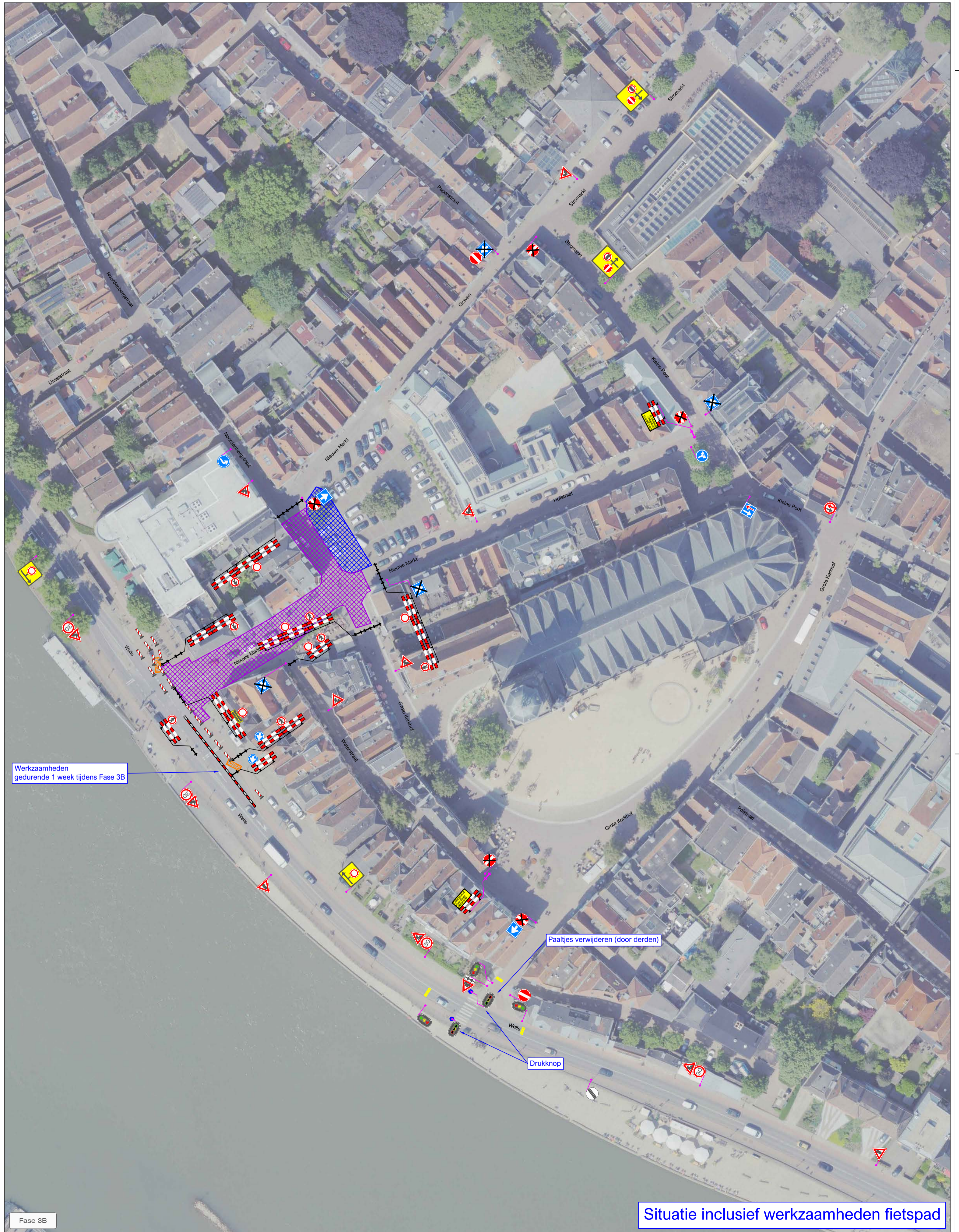
Situatie inclusief werkzaamheden fietspad