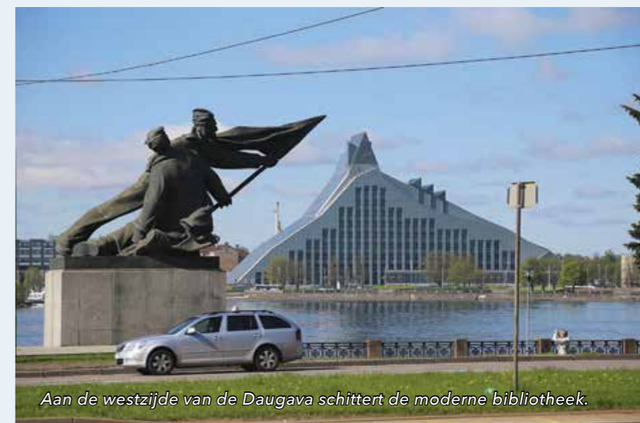
Aan de westzijde van de Daugava schittert de moderne bibliotheek.

In 1510 versierden kooplieden in Riga voor het eerst kerstbomen. Gebruikt werden bloemen. Vanuit Riga verspreidde de gewoonte om dennen met Kerstmis te versieren door de gehele christelijke wereld.