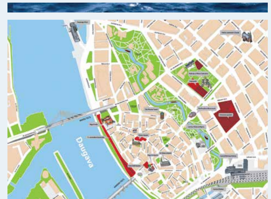
De locaties waar in Riga de Hanzedag 2021 plaats vindt, bevinden zich alle op loopafstand in het oude centrum.

keren terug en wel in 1636, 1655, 1656 en 1665. Na de laatste epidemie besloot de stadsregering dat huizen waar besmetting met de pestbaci was vastgesteld, met een P moest worden gemerkt. De privacy van de patiënt was niet belangrijk in de Hanzetijd.