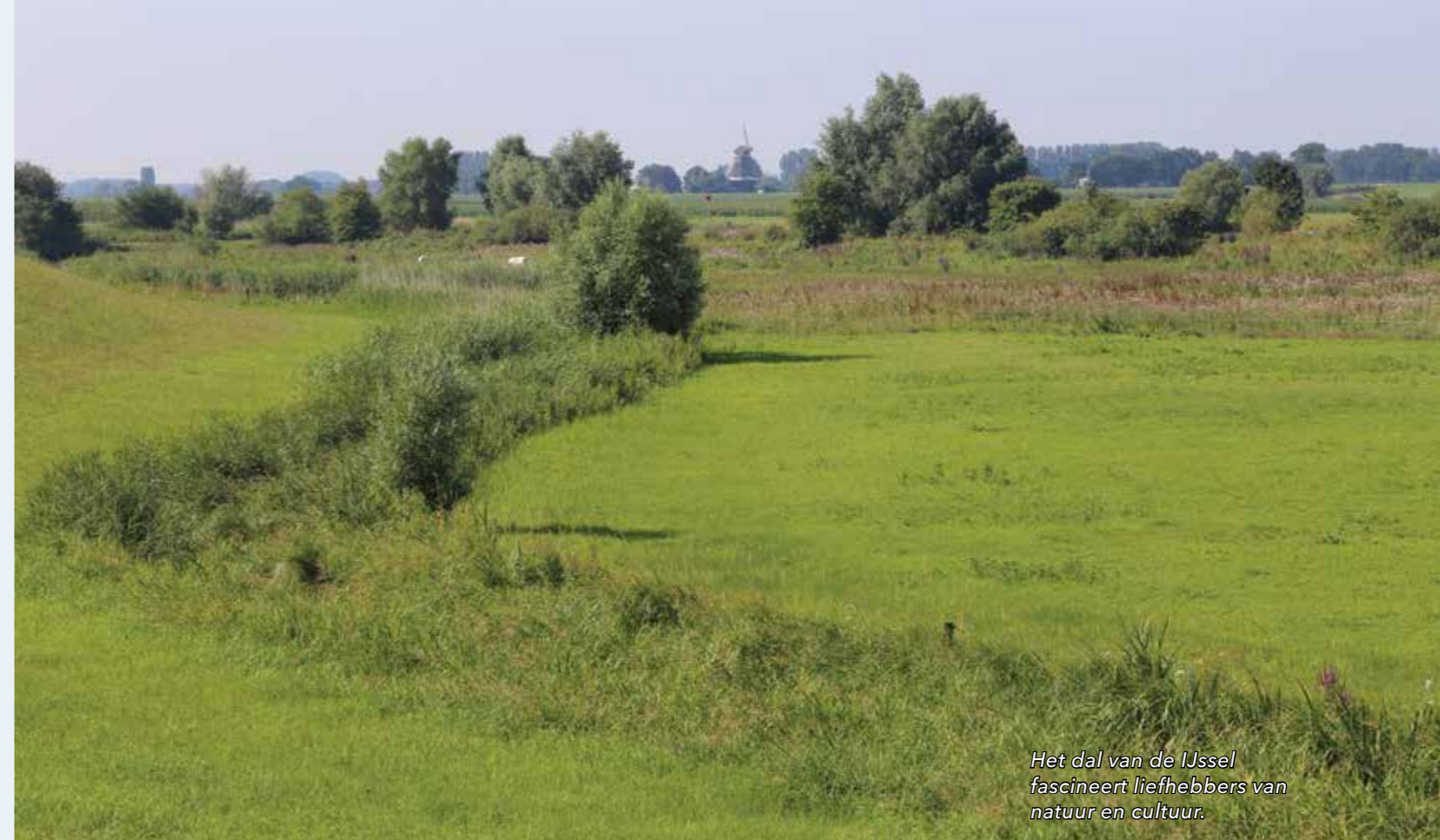
Het dal van de IJssel fascineert liefhebbers van natuur en cultuur.

segment stadstoerisme. Gerekend wordt een bijdrage te leveren aan de trend van korte stedentrips met flankerende aanbiedingen om het cultuur-toeristische erfgoed in de Hanzecorridor te versterken. De voor diverse doelgroepen geschikte fietsroute en de aan het water gelegen Hanzesteden worden gezien als ankerpunten voor het achterland.