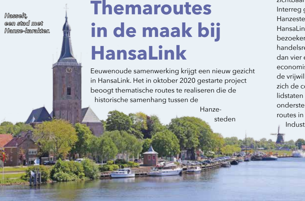
Hasselt, een stad met Hanze-karakter.

Reacties en bijdragen aan HalloHanze zijn van harte welkom. Stuur ze op naar: HalloHanze@theoleone.nl