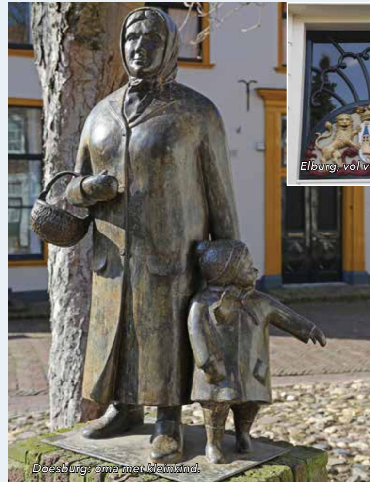
Doesburg: oma met kleinkind.

authentiek verhaal te vertellen zijn. Bovendien geldt als voorwaarde dat volop is meegedaan in de Hanzetijd. Een tweede punt van belang is de aanwezigheid van een historisch decor. Denk aan stadspoorten, grachten en karakteristieke pakhuizen. Hoe is anders aan gasten de belofte van een historische handelsstad waar te maken, vragen de marketeers zich af. Sterker nog, het criterium historisch decor is in hun ogen het belangrijkste criterium. De vier andere ijkpunten om zich aan te sluiten betreffen de duiding (meertalige informatieborden), dynamiek (evenementen en terrasjes), aansluiting bij het gekozen historische beeld aan het water en de geografische ligging. De nieuwe Hanzesteden volgens het toeristische samenwerkingsverband mogen zich hooguit op een uur rijden van elkaar bevinden. De groep van negen bestaat uit: Deventer, Doesburg, Elburg, Harderwijk, Hasselt, Hattem, Kampen, Zutphen en Zwolle.