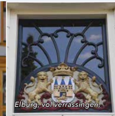
Elburg, vol verrassingen.