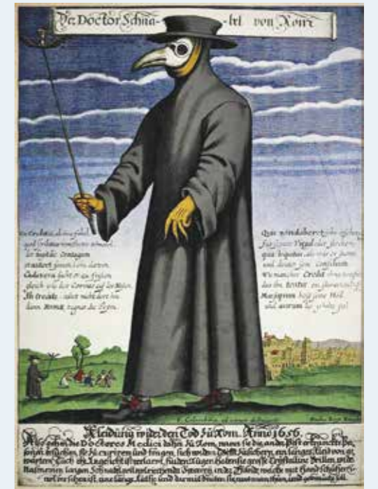
Snaveldokter in vol ornaat.

van de samenleving afgezonderd. In Zwolle werd 't Pestengasthuys gebouwd aan de buitenkant van de stadsmuur. Hier werden de zieken verpleegt door nonnen. Dappere artsen droegen een wel heel bijzonder mondkapje, een snavelmasker met kruidenmix, om zich te beschermen tegen de ziekte. Tegenwoordig kan je er trouwens lekker eten. In Deventer kwam het Sint Geertuiden- of Pestgasthuis tot stand. De pest kwam meerdere