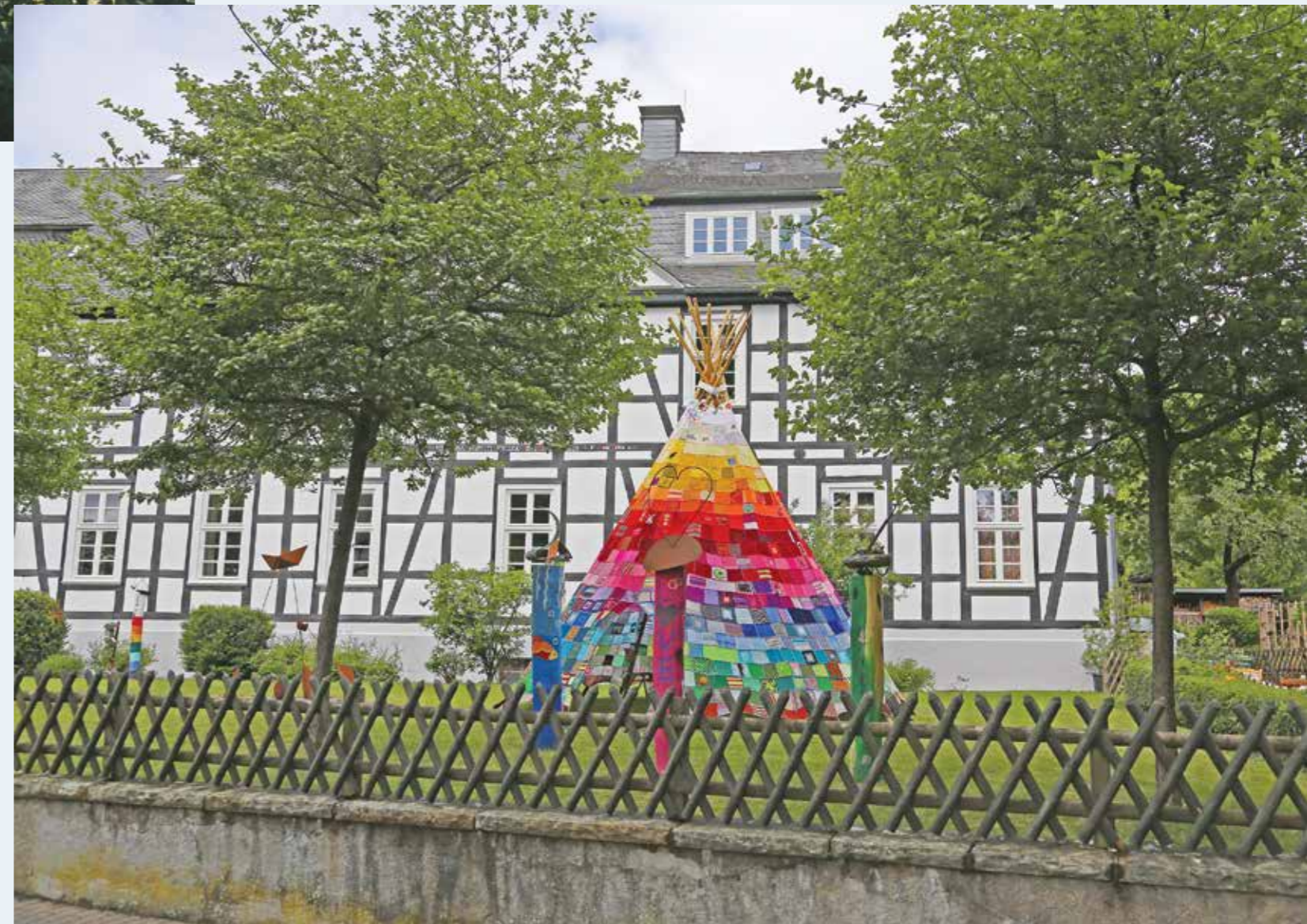
In 2021 andermaal kleurige wigwams tegen het decor van vakwerkhuizen.

een bedrag van 1161 euro. Het bedrag kwam uit de opbrengst van de drive-in op 7 juni waarbij Hanzeproducten verkocht werden. De drive-in was bedacht om na het schrappen van de fysieke Hanzedagen toch nog iets over te houden aan de extra ingekochte en vervaardigde producten ter herinnering aan Brilon 2020.