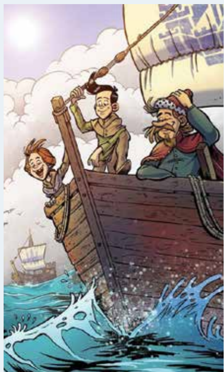
In den Olden Sint Olaf.

Een andere detail. Zakkenrollers bestonden zeven eeuwen geleden nog niet. Heel eenvoudig, de kleren hadden geen zakken. Kostbaarheden als geld werden meege dragen in buidels, vastgemaakt aan de riem. Gauwdieven heetten dan ook buidelsnijders. Wie betrap werd, raakte zo maar zijn duimen of oren kwijt. Als je al niet aan de galg kwam te hangen. In Deventer hing vrouwelijke buidelsnijders boven het hoofd een ronde door de stad met een schandsteen om de hals. Altijd nog beter dan het kwijtraken van je duimen. De plannen tot het maken van de Hanzestrip maakten begin 2020 veel enthousiasme los. Via crowdfunding werd binnen acht weken 15.000 euro opgehaald. De Bergenvaarders is opgebouwd uit verschillende lagen en zo geschikt voor kijk- en leeslustigen van elf tot minstens tachtig. De Bergenvaarders verschijnt bij uitgeverij Syndikaat te Epse, www.syndikaat.nl .