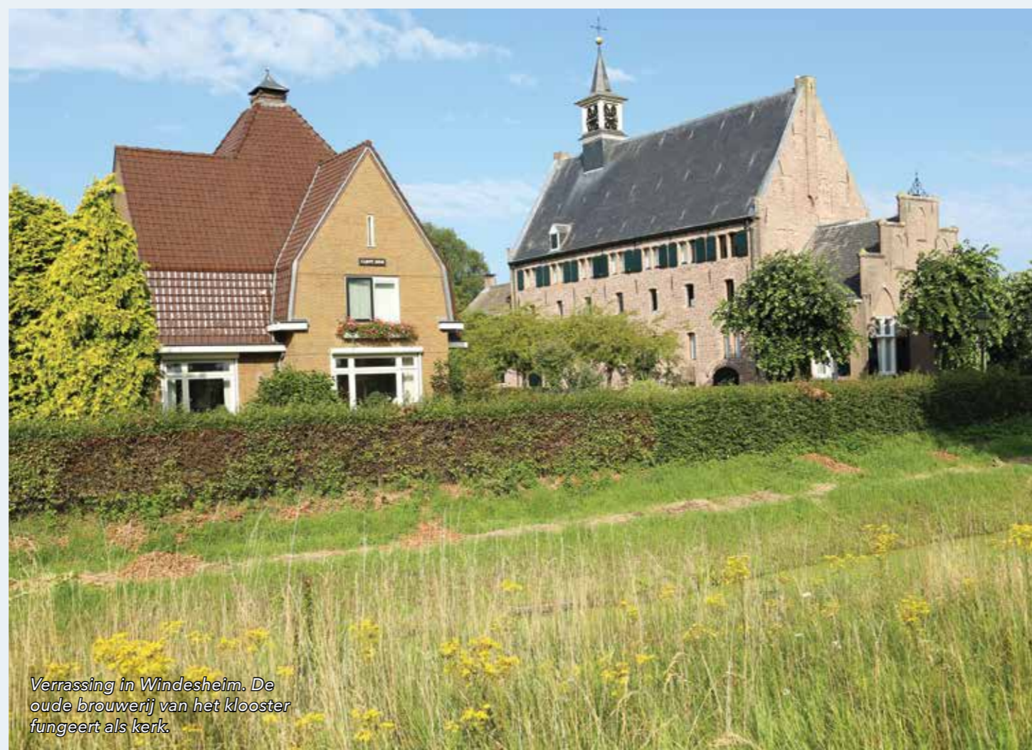
Verrassing in Windesheim. De oude brouwerij van het klooster fungeert als kerk.