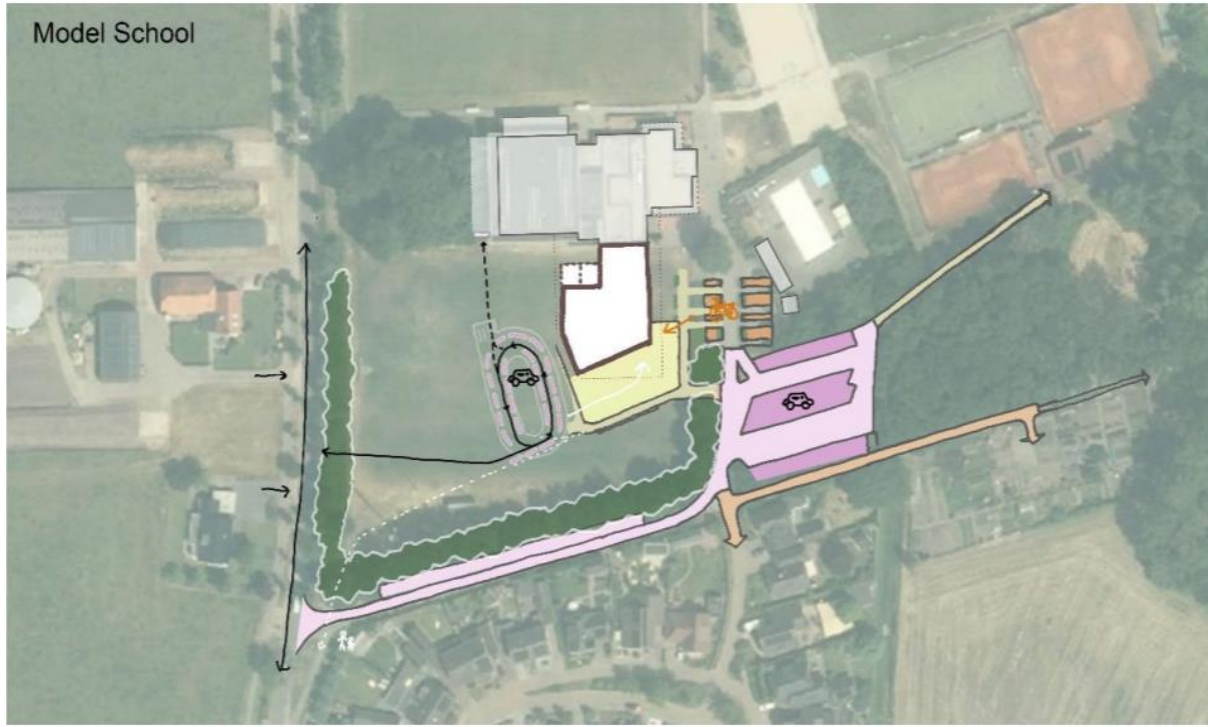
Afbeelding 9 Schematische opzet met verkeerssituatie 'Model School'.