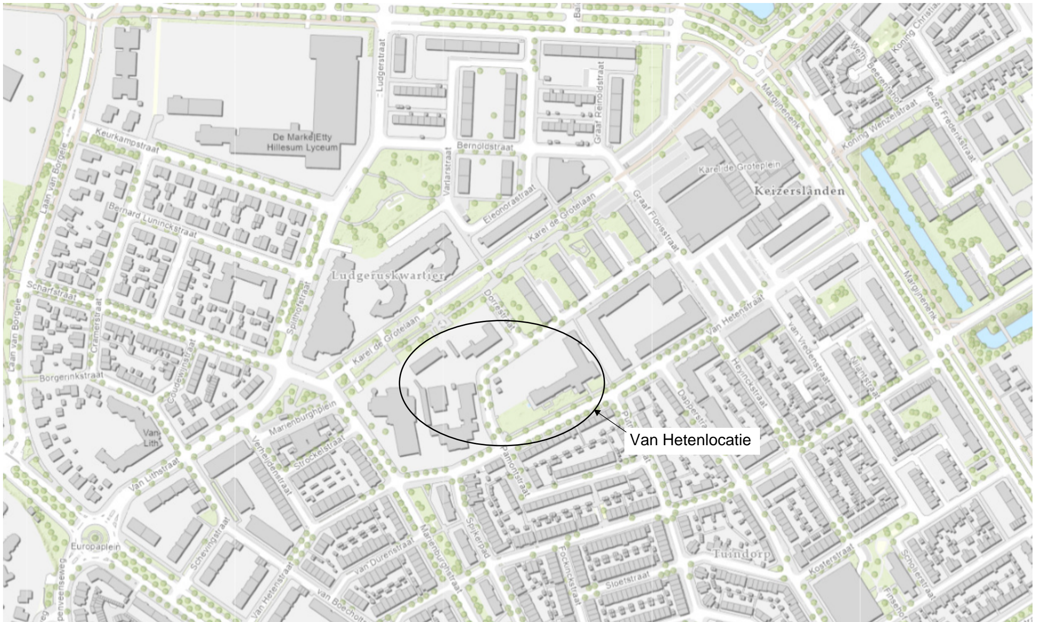
Bijlage 1: Bestaande situatie