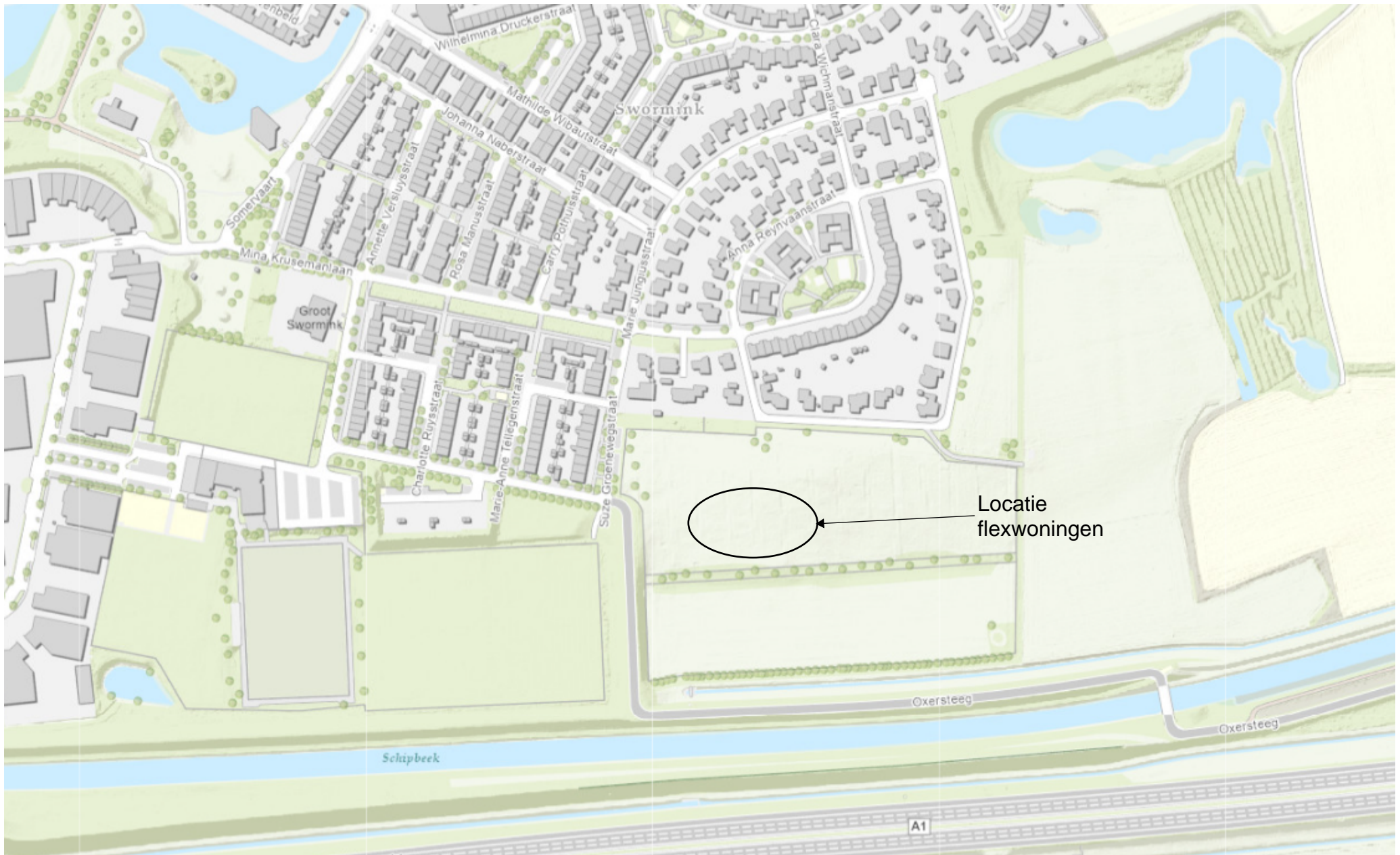
Bijlage 1: Bestaande situatie