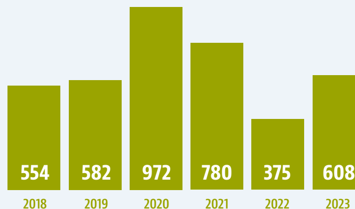
Politiemeldingen jeugdoverlast per jaar

Door de partijen in de jeugdnetwerken wordt continu aandacht besteed aan kwetsbare en risicovolle jeugd. Jongeren lijken sneller vatbaar voor criminaliteit. Veiligheidspartners, jeugdhulpverleners, leerplichtambtenaren en jongerenwerkers werken samen om jeugdoverlast te voorkomen en problemen bij jongeren tijdig te signaleren en aan te pakken. Er zijn verschillende initiatieven opgezet om jongeren te ondersteunen bij het vinden van een positieve invulling van